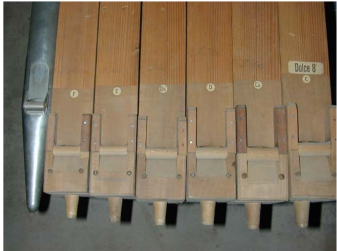
Dolce Lager Wälti

Das Register Dolce 8' war 1948 ausgebaut worden. Die fehlenden Pfeifen konnten aus dem Lagerbestand der Firma Wälti ersetzt werden. Die Klangkörper stammen aus der ehemaligen Gollorgel, Opus 74, in Vevey (anglikanische Kirche) von 1889. Das Instrument wurde 1909 durch Goll nach Gampelen in ein älteres Gehäuse gestellt. Das Werk wurde 1993 durch Orgelbau Wälti demontiert und das Dolceregister aufgehoben und eingelagert.