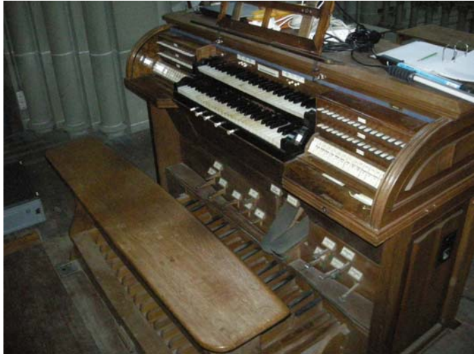
Spieltisch am 28. Juni 2010

Die pneumatischen Steuerelemente wurden demontiert. Die Klaviaturen wurden ausgebaut, die Tasten gereinigt. Defekte und stark abgenutzte Elfenbeinbeläge sind ersetzt worden. Die alten Beläge wurden gebleicht. Alle Filzgarnituren an den Tastenführungen mussten ersetzt und Führungsstifte poliert werden. Die Anschlagfilze wurden ersetzt. Die Tastenhöhe und der Tastengang wurden neu eingestellt. Rekonstruktion der Leisten, der Frontleisten über dem zweiten Manual und unter dem ersten Manual.