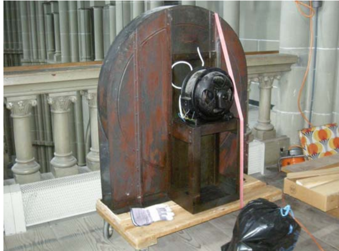
Gebälge nach dem Ausbau

Die Isolation der Türe zum Motorraum konnte verbessert werden. Die Kanäle wurden teilweise mit Leder neu gedichtet. Wir haben die Balgdeckel geöffnet und die Anlage von innen gereinigt und kontrolliert. Die Balgbelederung musste an einigen Stellen ersetzt oder verstärkt werden. Die Ansaug- und Rückschlagventile wurden gereinigt, Risse im Holz des Balginnern mit Lederstreifen abdichtet. Die Winddrossel wurde revidiert. Die noch intakte Handschöpfanlage konnte belassen werden.