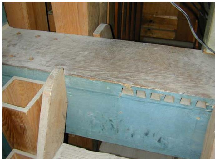
Stock Dolce 8' auf dem Kanal vor der Restauration

Der Pfeifenstock auf dem horizontalen Windzufuhrkanal der unteren HW-Lade ist noch vorhanden. Die ursprüngliche Anspeisung über Konduktbretter ist sichtbar. Die Pfeifen (C-F aus Holz) aus unserem Lager passten exakt auf den vorhandenen Pfeifenstock. Die Konduktbretter sind neu rekonstruiert worden.