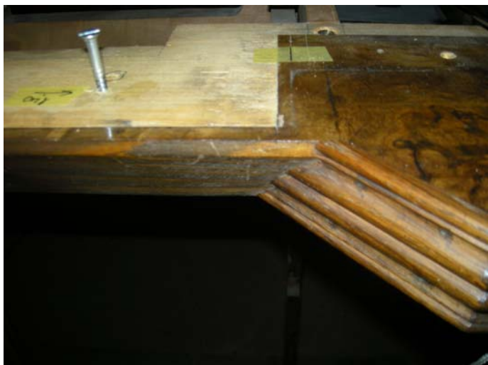
Ausschnitt am Basisbrett von 1948

Die Klaviaturen wurden beim Umbau 1948 zurückversetzt. Dabei wurde das Basisbrett auf dem die Klaviaturen liegen ausgeschnitten. Der Ausschnitt musste mit samt der Profilleiste ergänzt werden.