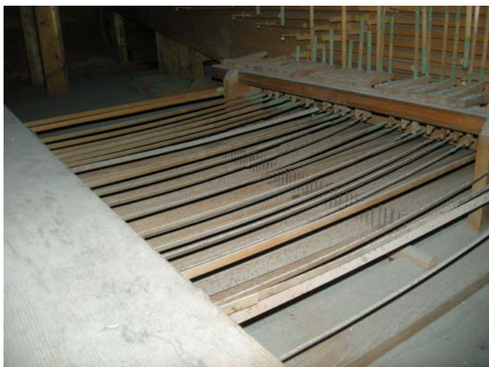
Traktur vor der Demontage

Wir vermuten, dass die gesamte Abstraktenführung von Beginn an nicht optimal und linear verlegt war. Die liegenden Abstrakten vom II. Manual und Pedal waren zum Teil stark verbogen, daraus resultierte durch die Reibstellen an den Führungen eine schwergängige Traktur. Die alten Abstrakten konnten mit wenigen Ausnahmen (einzelne waren zu dünn) behalten werden. Um eine spieltechnisch wichtige Optimierung zu realisieren, haben wir bestehende Führungen versetzt. Neue Aufhängungen verhindern Reibungen und auch ein Abkippen der Abstrakten. Abgenutzte Austuhungen mussten teilweise ersetzt werden.