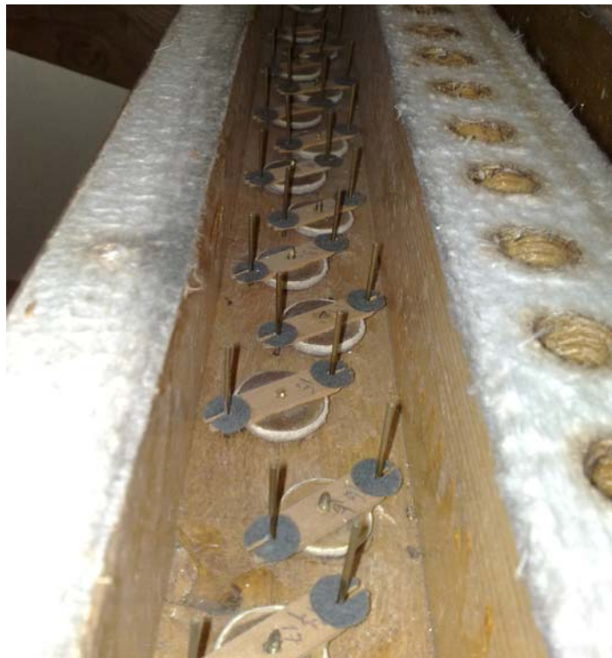
Registerkzelle mit Kegel

An den Windladen und deren Traggestellen wurde praktisch kein Schädlingsbefall festgestellt. Bei den wenigen Stellen erfolgte eine partielle Behandlung mit geeigneten Mitteln. Die Registerkzellen, die Kegel und deren Führungen wurden gereinigt und kontrolliert. Die Registerkzellen waren oben nicht mit Papier gedichtet, ausser die Kzelle der Trompete aber nur auf der C - Seite. Die Kzellen beider Zungenregister haben wir aus Sicherheitsgründen neu papiert. Die Dichtungen aus Molton wurden gereinigt, aufgebürstet. Einzelne Stellen waren undicht und mussten ersetzt werden. Es erfolgte eine Dichtheitskontrolle aller Laden.