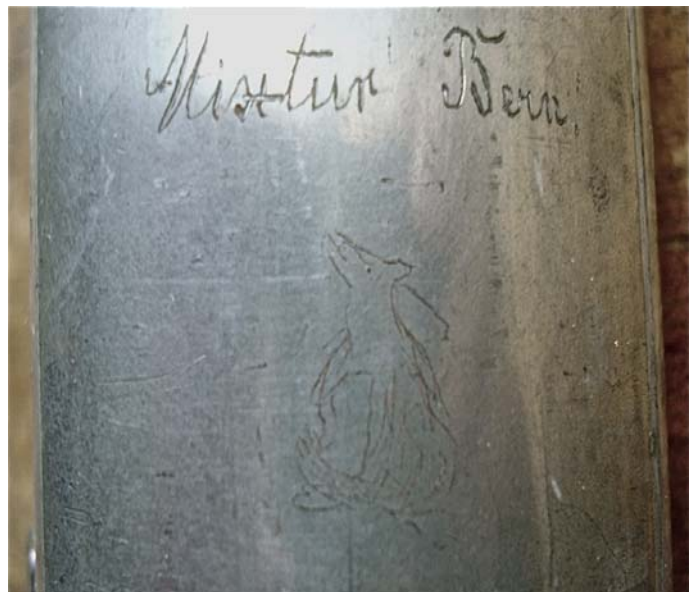
originale Pfeife C 2 2 / 3 ' mit Bär

Die Mixturzusammenstellung erfolgte nach den Angaben des Werkvertrages von 1884 und aus den noch vorhandenen Mixturpfeifen.