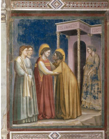
Maria besucht Elisabeth, Giotto