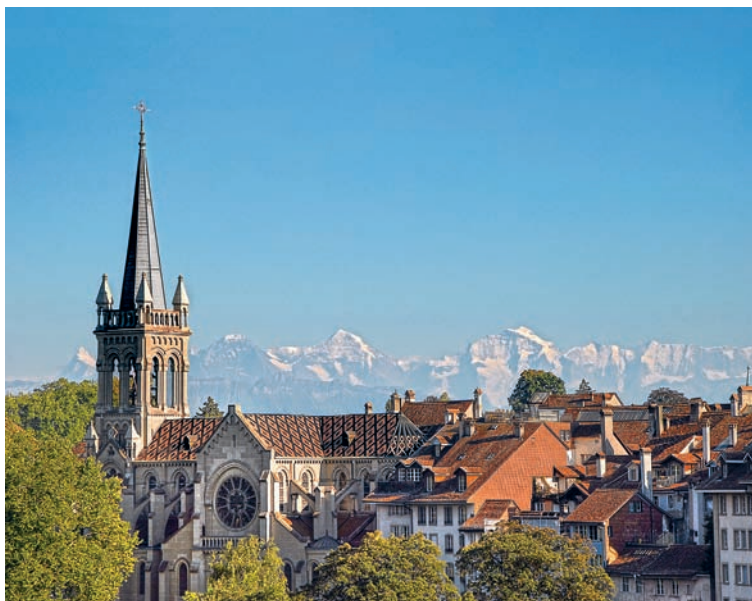
St. Peter und Paul Blick von der Kornhausbrücke