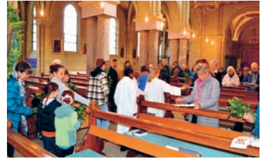
Palmsonntag: Eucharistiefeier mit Segnung und Austeilung der Palmzweige