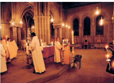
Osternacht: am Osterfeuer – Lob des Osterlichts, das weitergegeben wird und die Kirche erhellt. Osterbuffet