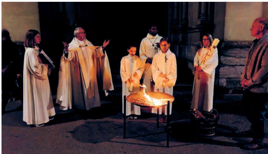
Osternacht 8. April 2023 Osterfeuer vor St. Peter und Paul, Bern