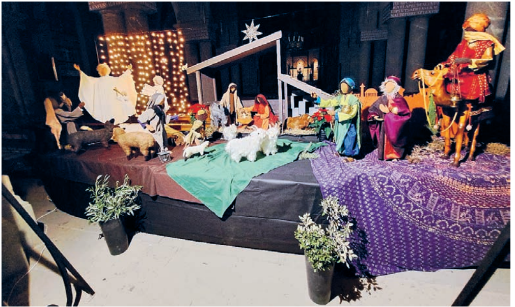
Heiliger Abend in St. Peter und Paul Bern