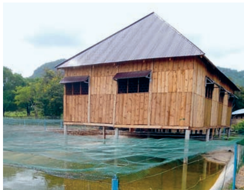
Fischteich mit Hühnerhaus in Sayuni

Fischteiche mit Hühnerhaus in Masasi, Bienenkästen in Sayuni und Traktoren für beide Standorte. Seit Jahren werden jährliche Beiträge an die Aus- und Weiterbildung der Schwestern geleistet. Die Bandbreite geht von Sekundarschulabschlüssen als Voraussetzung für Berufslehren bis zur fachlichen Weiterbildung im Gesundheitsbereich.