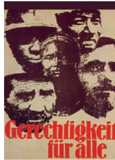
1. Kampagne 1973