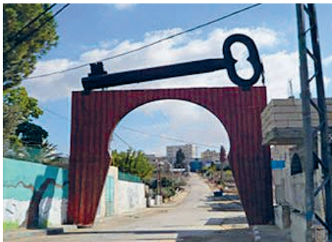
Schlüsselsymbol über Flüchtlingslager

Das von verschiedensten Volksgruppen dünn besiedelte Gebiet Palästina war 700 Jahre unter römischer, ab 638 unter muslimischer Herrschaft und von 1516 bis zum Ende des 1. Weltkriegs Teil des Osmanischen Reiches. Nach dessen Niederlage teilten die Siegermächte Grossbritannien und Frankreich das Gebiet unter sich auf, ohne Einbezug der arabischen Bevölkerung. 1920 erhielt Grossbritannien das Völkerbundmandat für Palästina, welches bis 1947 bestand, als die UN-Generalversammlung die Teilung Palästinas in einen arabischen und einen jüdischen Staat und die Unterstellung Jerusalems unter internationale Kontrolle beschloss. Am 14. Mai 1948 rief der jüdische Nationalrat den unabhängigen Staat Israel aus. Einen Tag später griffen die arabischen Staaten Israel an. Israel schlug zurück, zerstörte 531 palästinensische Dörfer und zwang 750'000 Palästinenser und Palästinenserinnen ihre Häuser zu verlassen und enteignete sie. Der 15. Mai ist seither der Tag der Nakba (Katastrophe), der Schlüssel das Symbol für die Rückkehr.