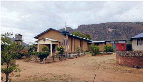
Die Kirche im Kloster in Masasi

Die Zusammenarbeit unserer Kirche mit der anglikanischen «Community of St. Mary of Nazareth and Calvary» (CMM) begann 1983 mit der Unterstützung des Kirchenbaus am Hauptsitz des Ordens in Masasi im Südwesten Tansanias.