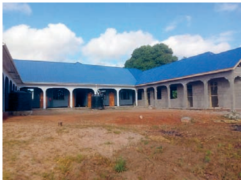
Der linke Flügel im Rohbau von der Rückseite

In einer ersten Etappe wurden 2017/18 der rechte Flügel und die Frontseite gebaut und 2019 eingeweiht. Die Eröffnung dieses ersten Teils verzögerte sich wegen Corona und konnte erst 2021 erfolgen. Der linke Flügel wurde 2023 gebaut. Innenausstattung und Aussenarbeiten sind für 2024 geplant.